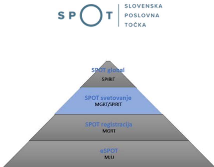
Slika 2-1: Sistem SPOT, Slovenska poslovna točka (SPOT točka)

Konkretno podpora podjetništvu in podjetniškemu okolju predstavlja sklop storitev na ravni 2-SPOT Registracija in ravni 3-SPOT Svetovanje, ki jih RIC izvaja v okviru sistema SPOT, Slovenske poslovne točke (SPOT točke). S storitvami pokriva predvsem območja občine Slovenska Bistrica, Makole, Poljčane in Oplotnica.